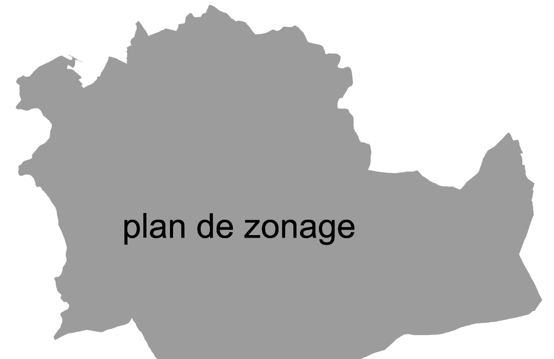
plan de zonage